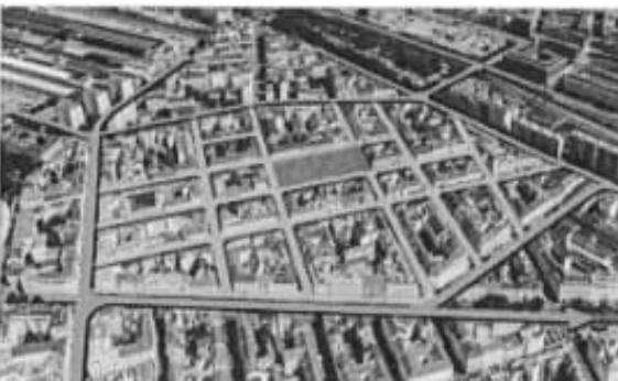
Untersuchungsgebiet der Superblock-Pilotstudie im Volkertviertel

Das Superblock-Konzept dient zur Analyse, Planung und Verwaltung kleinräumiger Stadtstrukturen unterhalb der Bezirksebene. Superblocks schaffen lebenswerte Wohnumfelder mit Möglichkeiten für neue Nutzungsangebote und -qualitäten im öffentlichen Raum. Somit sind Superblocks eine Planungsinnovation, die sich auf die Mobilität, Umweltqualität, lokale Wirtschaft, BürgerInnen-Beteiligung, grüne Infrastruktur und auf den öffentlichen Raum auswirken kann.