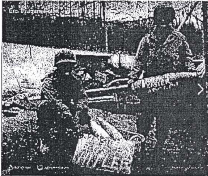
Alliierte Soldaten, offensichtlich afroamerikanischer Herkunft, mit Granaten und Osterwünschen für „Adolph“